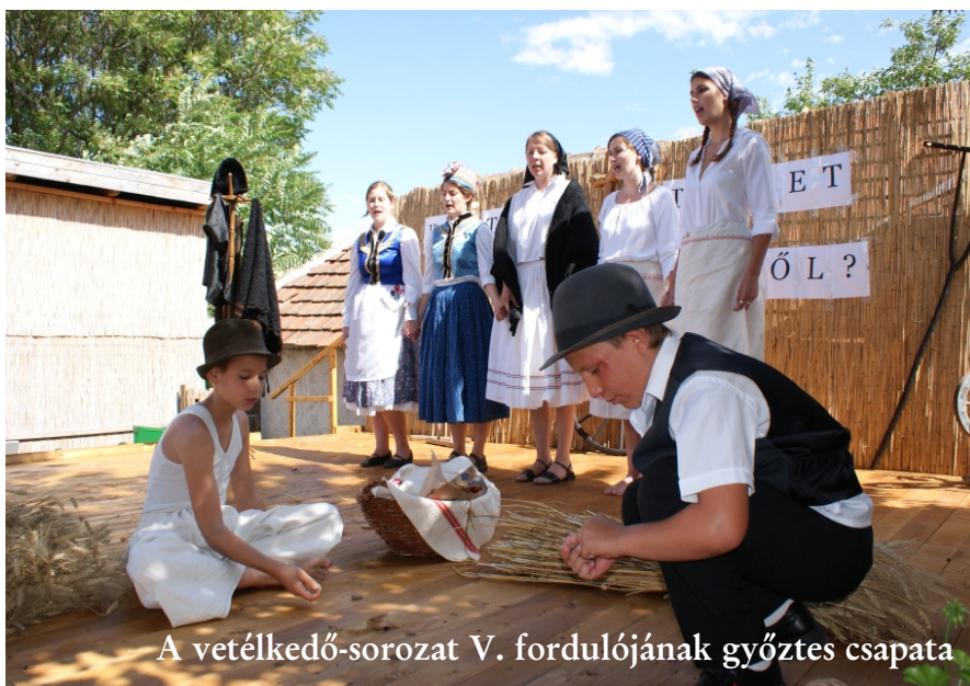
A vetélkedő-sorozat V. fordulójának győztes csapata