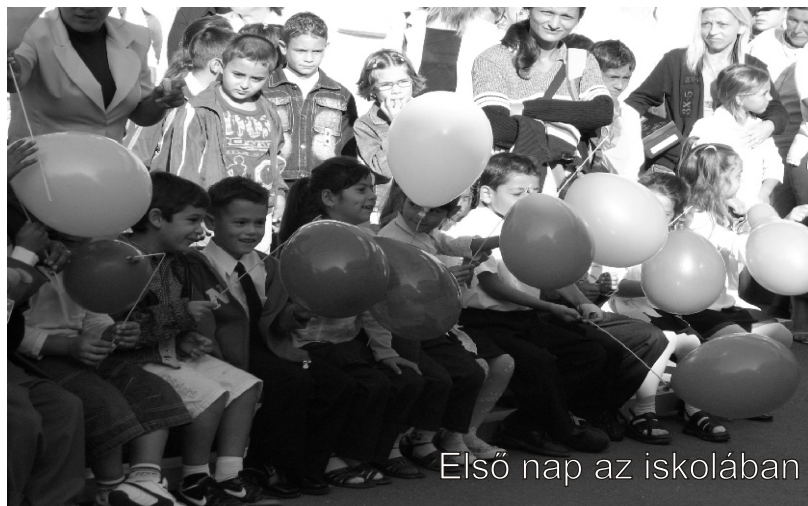
Első nap az iskolában

Hervad a nap, bágyad Száll a napsugár Levelekkel együtt elfáradt a nyár Összecsomagolja minden holmiját A sok jó időt és a fürdőruhát És emeli karját és sípjába fűj Elég volt kispajtás mostantól tanulj! Virágok helyett már nyit az iskola És sarkáig tárva barna kapuja Ég helyett a tábla, Park helyett a pad Hív a szelíd ősze, érezd jól magad! És a havas télben, napsugár helyett A tudás fényei melegítenek!